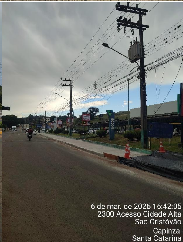
6 de mar. de 2026 16:42:05 2300 Acesso Cidade Alta Sao Cristóvão Capinzal Santa Catarina