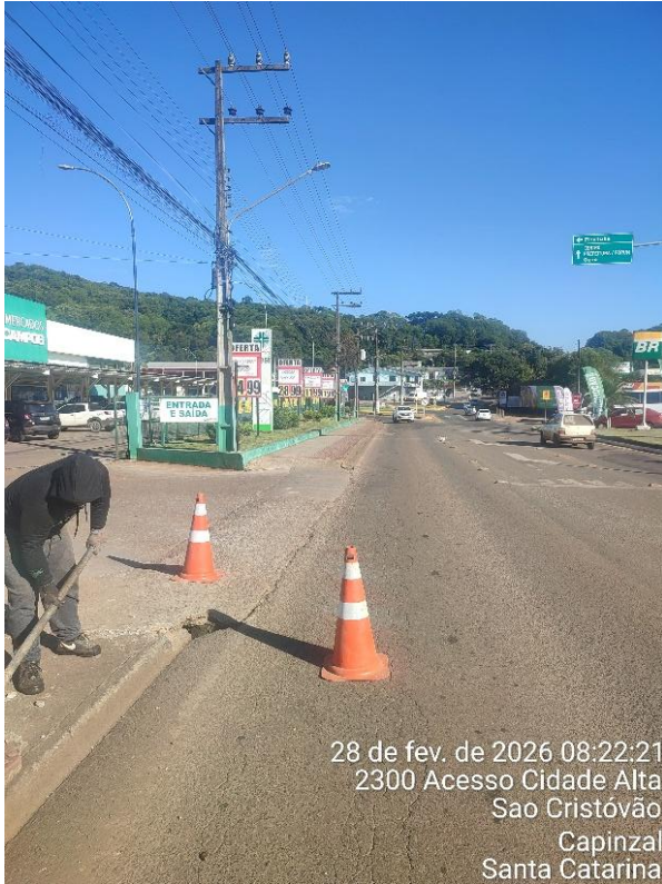
28 de fev. de 2026 08:22:21 2300 Acesso Cidade Alta Sao Cristóvão Capinzal Santa Catarina