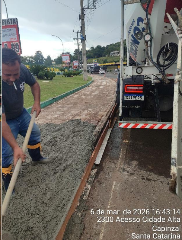
6 de mar. de 2026 16:43:14 2300 Acesso Cidade Alta Capinzal Santa Catarina