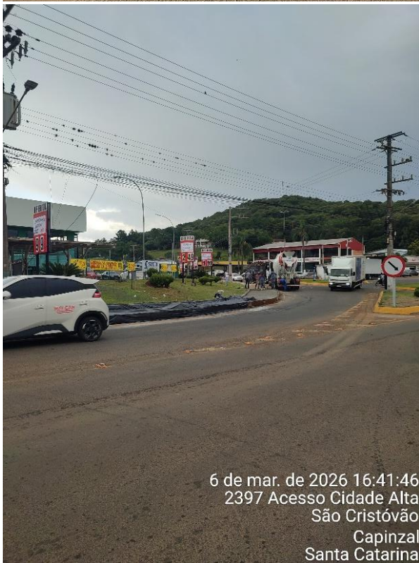
6 de mar. de 2026 16:41:46 2397 Acesso Cidade Alta São Cristóvão Capinzal Santa Catarina