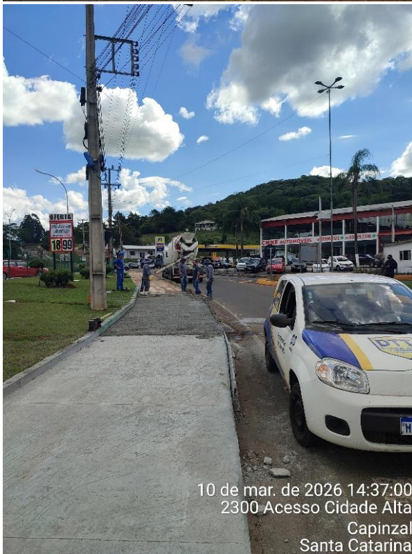
10 de mar. de 2026 14:37:00 2300 Acesso Cidade Alta Capinzal Santa Catarina