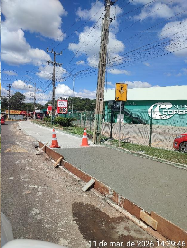
11 de mar. de 2026 14:39:46