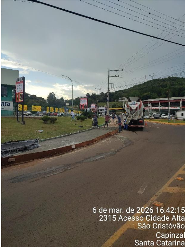
6 de mar. de 2026 16:42:15 2315 Acesso Cidade Alta São Cristóvão Capinzal Santa Catarina