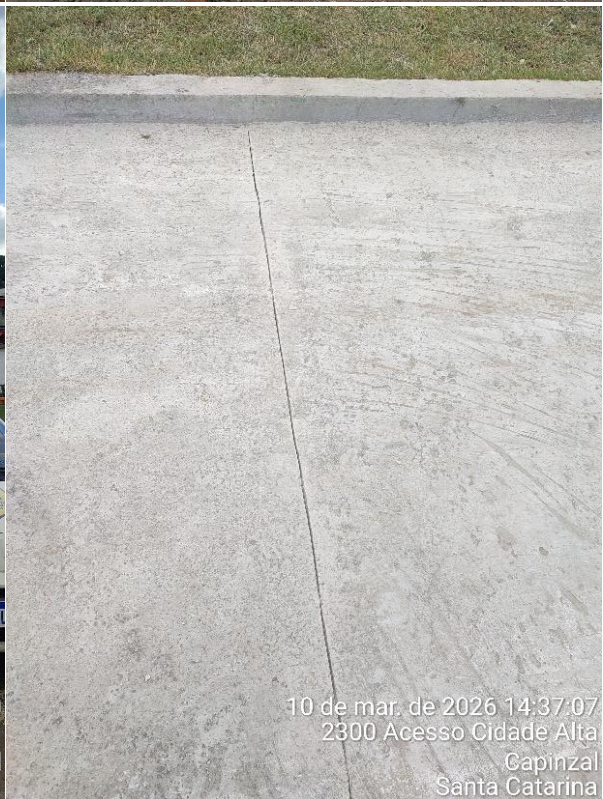
10 de mar. de 2026 14:37:07 2300 Acesso Cidade Alta Capinzal Santa Catarina